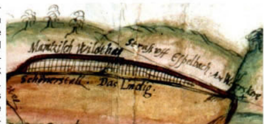
Die Karte des Hafenlohrtrals aus dem späten 16. Jahrhundert zeigt an ihrem oberen Rand den Maintzisch Wildthag, ein Wildgehege, das in der Nähe des Geiersberges lag, der höchsten Erhebung des Spessart (586m).

südlich den löwensteinischen Park um die Karlshöhe und den erbachischen Wildpark im Südspessart. Heute gibt es noch eine Reihe von kleinen Wildparks, z.B. in Bad Orb, Flörsbachtal, Haibach, Heigenbrücken und Schollbrunn. Hier fühlen sich vor allem Familien mit Kindern wohl, die hier die Möglichkeit haben, „wilde“ Tiere hautnah zu erleben und vielleicht sogar zu streicheln.