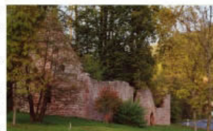
Die Geschichte der Markuskapelle ist mit der Kartause Grünau eng verknüpft.