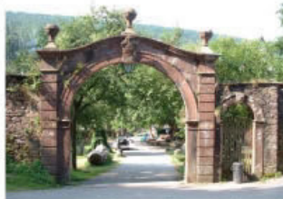
Die ehemalige Kartause Grünau ist Idylle und Ausflugsziel zugleich.

Südlich der Apfel-Appel-Sprachgrenze - sprich des „Äppeläquators“ - liegt um Schollbrunn und Grünau, dem ehemaligen Kloster der Kartäuser, eine Kulturlandschaft, in die der Mensch seit über 750 Jahren gestaltend einwirkt. Dies wird an den Ruinen der Markuskapelle oder der Kartause Grünau fühlbar. Schollbrunn befindet sich im Grenzbereich der früheren Grafschaft Wertheim, dem Kurmainzer Spessart und dem Bistum Würzburg, weshalb der Dorfplatz „Dreimärker“ genannt wird.